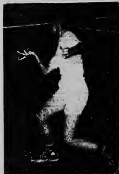
Un momento di tension durante e weganan pa campeonato individual pa juniors, cual diadomingo u. p. a ser organisa door di A.T.T.A.

BUENOS AIRES, 4/3 — E ministro di asuntunan exterior di Argentina, dr. Carlos Florit, a informa, cu el a rechaza un nota cu e embahador di Paraguay a ofrece, en conexion cu e notificacion di prensa Argentino tocante e situacion na Paraguay. E nota di protesta a ser ofreci durante un discusion entre e embahador y e ministro y durante cual e embahador a protesta na nomber di su gobierno contra "declaracionnan ofensivo di cierto organo di prensa Argentino, cu ta duna un mal impresion di su gobierno y cu ta desfigurá hechonan normal politico". E ministro Argentino a contesta bisando, cu na Argentina ta existi libertad completo di prensa y cu esey ta worde aplicá y cu su gobierno no tin nada di haci ni e no tin intencion di entremete cu expresionnan di opinion publico.